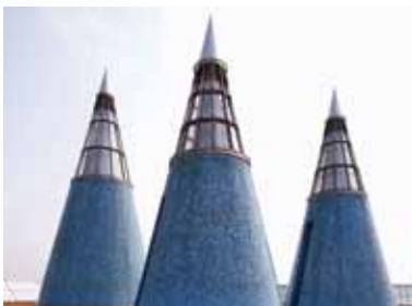
Bundeskunsthalle, Forum Friedrich-Ebert-Allee 4 53113 Bonn Museumsmeile