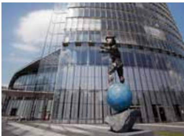
Post Tower Charles-de-Gaulle-Str. 20 53113 Bonn Rheinaue