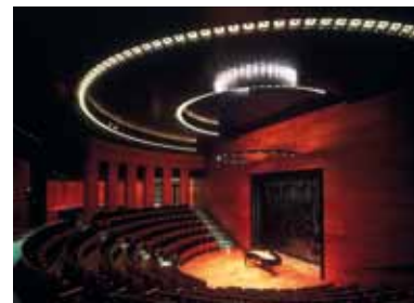
Beethoven-Haus Bonn, Kammermusiksaal Bonngasse 24-26 53111 Bonn Bonn-Zentrum