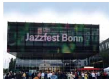
Telekom Forum Landgrabenweg 151 53227 Bonn Beuel-Süd

Karten erhalten Sie an allen bekannten Vorverkaufsstellen und unter www.bonnticket.de Detaillierte Informationen und Hörbeispiele finden Sie unter www.jazzfest-bonn.de Abonnieren Sie unseren Online-Newsletter!