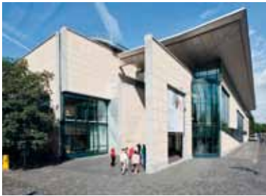
Haus der Geschichte Willy-Brandt-Allee 14 53113 Bonn Museumsmeile