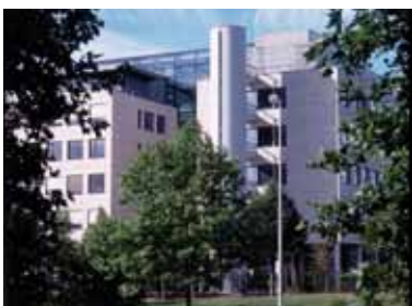
Volksbank-Haus Volksbank Bonn Rhein-Sieg Heinemannstr. 15 53175 Bonn Rheinaue