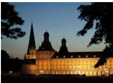
Universität Bonn, Aula Regina-Pacis-Weg 3 53113 Bonn Bonn-Zentrum